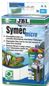
JBL Symec micro Mikrovlies für Aquarienfilter gegen Wassertrübungen