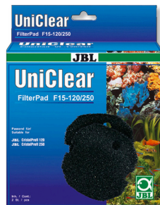
JBL FilterPad F15 Espuma de poro grueso para el filtro CristalProfi