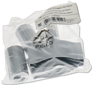
JBL LED SOLAR - Kit d'embouts