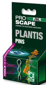
JBL PROSCAPE PLANTIS PINS Pflanzennadeln zur Fixierung von Aquarienpflanzen