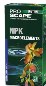
JBL PROSCAPE NPK MACROELEMENTS Engrais végétal à 3 composants pour aquascaping