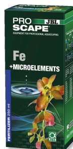
JBL PROSCAPE Fe + MICROELEMENTS Základní hnojivo na rostliny pro aquascaping