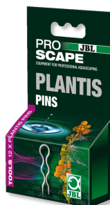
JBL PROSCAPE PLANTIS PINS Jehlice na rostliny k upevnění akvarijních rostlin