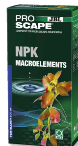
JBL PROSCAPE NPK MACROELEMENTS 3složkové hnojivo na rostliny pro aquascaping