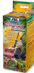
JBL TempSet angle+ connect Installation kit for lamps in terrariums