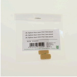
JBL DigiScan Alarm cirt-cirt, 2 set