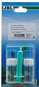
JBL set pro testování vody