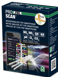
JBL PROSCAN Test de l'eau avec analyse sur smartphone