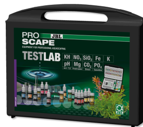
JBL PROAQUATEST LAB PROSCAPE Coffret d'analyse de l'eau en aquarium planté