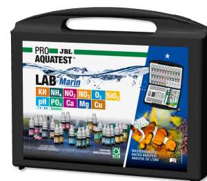
JBL PROAQUATEST LAB Marin Profesjonalna walizka testów do analizy wody morskiej