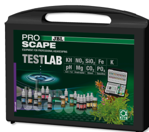
JBL PROAQUATEST LAB PROSCAPE Walizka testów do analizy wody w akwariach z roślinami