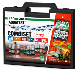
JBL PROAQUATEST COMBISET POND Coffret d'analyses d'eau en bassins