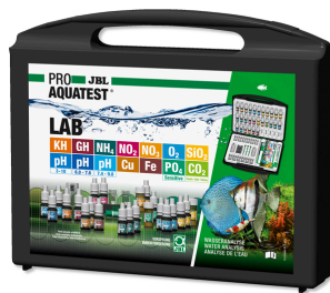
JBL PROAQUATEST LAB Maletín con 13 test para analizar el agua dulce