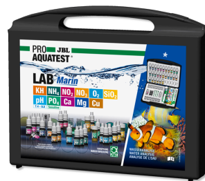
JBL PROAQUATEST LAB Marin Mala de teste profissional p/ análise de água salgada