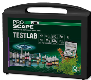
JBL PROAQUATEST LAB PROSCAPE Mala de teste p/ análise à água em aquários de plantas