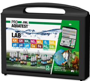
JBL PROAQUATEST LAB Mala de teste, 13 testes de água p/ analisar água doce