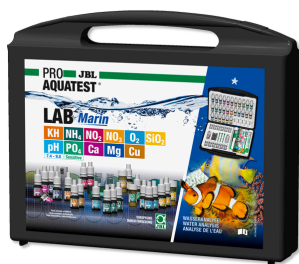
JBL PROAQUATEST LAB Marin Mala de teste profissional p/ análise de água salgada