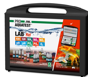
JBL PROAQUATEST LAB Koi Mala de teste profissional p/ lagos de Koi e de jardim