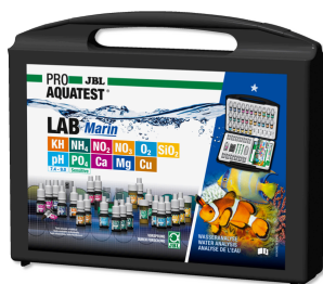
JBL PROAQUATEST LAB Marin Profes. testovací kufřík pro analýzu mořské vody