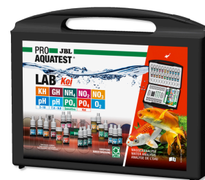
JBL PROAQUATEST LAB Koi Prof. testovací kufřík pro koi a zahr. jezírka