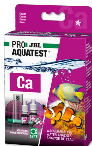
JBL PROAQUATEST Ca Calcium Sneltest voor het bepalen van het calciumgehalte