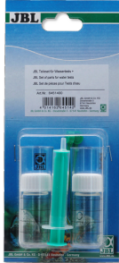
JBL Set de piezas de test para el agua