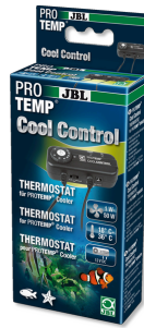
JBL PROTEMP CoolControl

Termostat pro regulaci chladicího ventilátoru