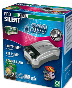
JBL PROSILENT a300 Vzduchové čerpadlo pro sladkovodní i mořská akvária