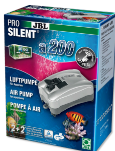
JBL PROSILENT a200 Vzduchové čerpadlo pro sladkovodní i mořská akvária