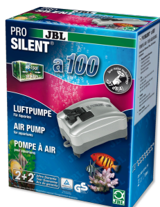
JBL PROSILENT a100 Vzduchové čerpadlo pro sladkovodní i mořská akvária