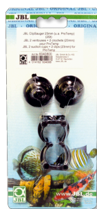
JBL klipová přísavka 23 mm Gumová přísavka pro objekty s průměrem 23-28 mm