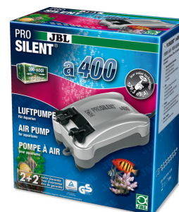
JBL PROSILENT a400 Vzduchové čerpadlo pro sladkovodní i mořská akvária