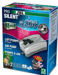
JBL PROSILENT a200 Vzduchové čerpadlo pro sladkovodní i mořská akvária