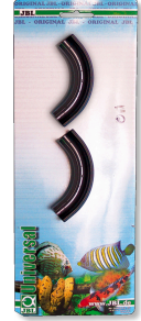
JBL Anti-Kink Hortumlar için bükülme önleyici

Yakl. 6 mm çap. nesnelere için klipsli saydam vantuzlar