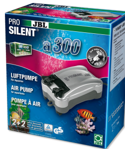
JBL PROSILENT a300 Tatlı su ve deniz suyu akvaryumları için hava pompası