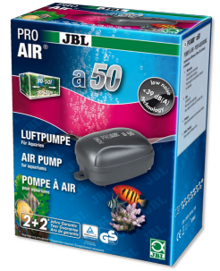
JBL PROAIR a50 Akvaryumlar için hava pompası

Çapı 16 mm olan objeler için lastik vantuz