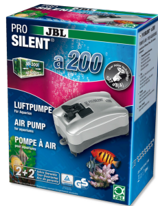
JBL PROSILENT a200 Tatlı su ve deniz suyu akvaryumları için hava pompası