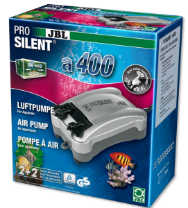
JBL PROSILENT a400 Tatlı su ve deniz suyu akvaryumları için hava pompası