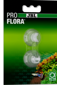
JBL klipsli vantuz 6 mm

Çapı 12 mm olan objeler için klipsli lastik vantuz