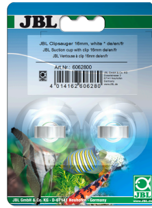
JBL klipsli vantuz 16 mm

Çapı 23-28 mm olan objeler için lastik vantuz