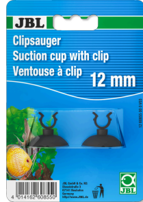
JBL klipsli vantuz, 12 mm

Çapı 12 mm olan objeler için klipsli lastik vantuz