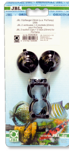
JBL klipsli vantuz, 23-28 mm

Çapı 23-28 mm olan objeler için lastik vantuz