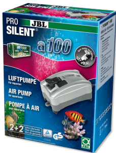
JBL PROSILENT a100 Tatlı su ve deniz suyu akvaryumları için hava pompası