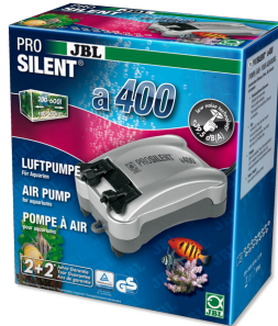
JBL PROSILENT a400 Luftpumpe für Süß- und Meerwasser-Aquarien