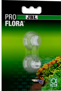
JBL Clipsauger 6 mm Transparente Sauger mit Clips für Objekte mit ca. 6 mm