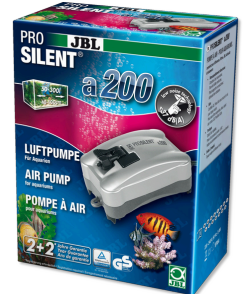
JBL PROSILENT a200 Luftpumpe für Süß- und Meerwasser-Aquarien