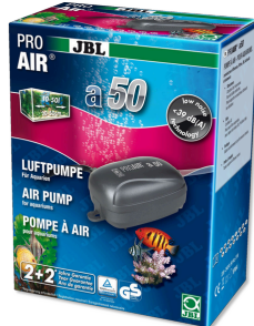
JBL PROAIR a50 Luftpumpe für Aquarien