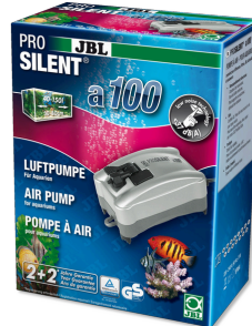
JBL PROSILENT a100 Luftpumpe für Süß- und Meerwasser-Aquarien