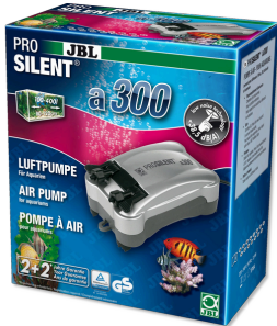
JBL PROSILENT a300 Luftpumpe für Süß- und Meerwasser-Aquarien