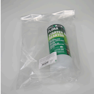
JBL PF CO2 STARTER BIO REAKTOR