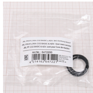
JBL PF CO2 BIO REAKTOR Dichtung