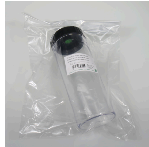
JBL PF CO2 BIO REAKTOR