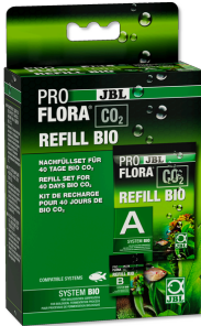
JBL PROFLORA CO2 REFILL BIO Nachfüllset für Bio-CO2-Düngeranlagen