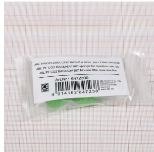
JBL PF CO2 BIO REAKTOR Filter