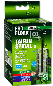
JBL PROFLORA CO2 TAIFUN SPIRAL 5 Erweiterbarer CO2-Reaktor für Süßwasseraquarien 200 l