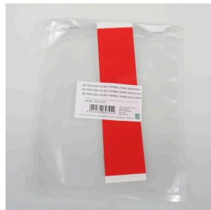
JBL PF CO2 BIO THERMAL CASING Klebestr.