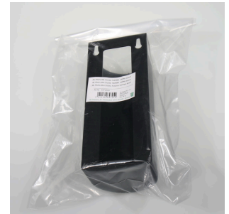
JBL PF CO2 BIO THERMAL CASING