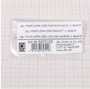
JBL PF CO2, U için düz conta