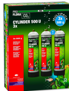
JBL PROFLORA CO2 CYLINDER 500 U 3x Bouteille de CO2 à usage unique, 500 g (pack de 3)