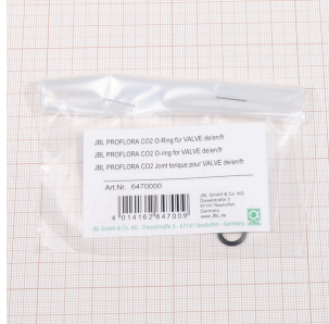
JBL PF CO2 Joint torique pour VALVE