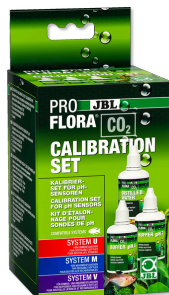
JBL PROFLORA CO2 CALIBRATION SET Ke kalibraci a uchování pH elektrod