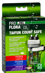
JBL PROFLORA CO2 TAIFUN COUNT SAFE CO2 počítadlo bublin s pojistkou proti zpětnému toku