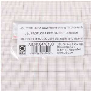
JBL PF CO2 plošné těsnění pro U