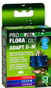
JBL PROFLORA CO2 ADAPT U - M Adaptér pro přestavbu jednor. lahvi CO2 na plnitelné