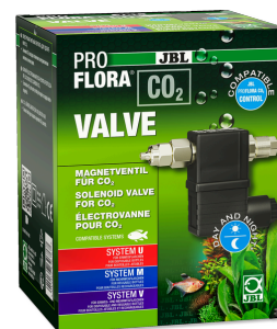
JBL PROFLORA CO2 VALVE CO2 magn. ventil pro kontrolu přívodu CO2