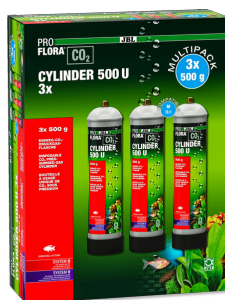
JBL PROFLORA CO2 CYLINDER 500 U 3x Jednorázová láhev 500 g s CO2 (výhodný set 3 ks)