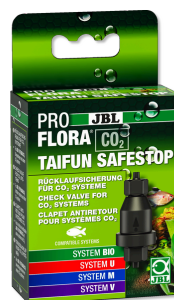
JBL PROFLORA CO2 TAIFUN SAFESTOP Pojistka proti zpětnému toku pro zařízení CO2