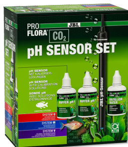
JBL PROFLORA CO2 pH SENSOR SET pH elektroda v lab. kvalitě pro pH přístroje