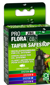
JBL PROFLORA CO2 TAIFUN SAFESTOP Wasserrücklaufsicherung für CO2-Anlagen