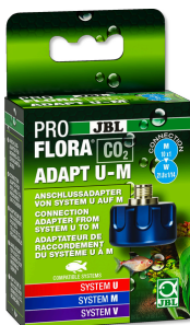
JBL PROFLORA CO2 ADAPT U - M CO2 Umrüstungs-Adapter von Einweg- auf Mehrwegflaschen