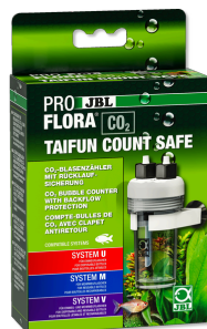
JBL PROFLORA CO2 TAIFUN COUNT SAFE CO2-Blasenzähler mit eingebauter Rücklaufsicherung