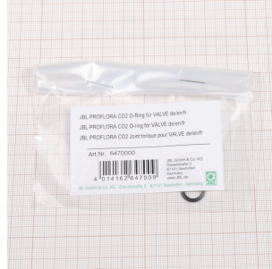
JBL PF CO2 O-Ring für VALVE