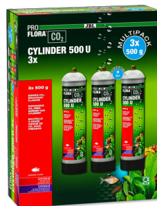
JBL PROFLORA CO2 CYLINDER 500 U 3x 500 g CO2-Einweg-Vorratsflasche (3er Vorteils-Pack)