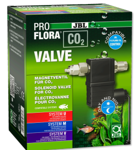
JBL PROFLORA CO2 VALVE CO2-Magnetventil für die kontrollierte CO2 Zugabe