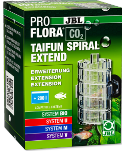
JBL PROFLORA CO2 TAIFUN SPIRAL EXTEND JBL PROFLORA CO2 TAIFUN SPIRAL 5 / 10 için genişletme