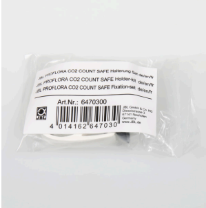
JBL PF CO2 COUNT SAFE Kit fixation