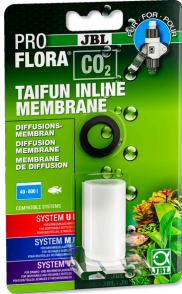
JBL PROFLORA CO2 TAIFUN INLINE MEMBRAAN

Vervangend membraan voor CO2 TAIFUN INLINE diffuser