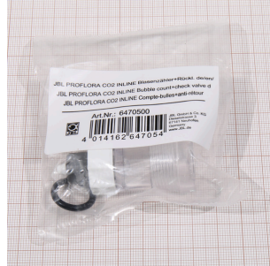
JBL PF CO2 INLINE bellenteller+ terugslagkl.

Vervangend membraan voor CO2 TAIFUN INLINE diffuser