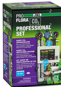
JBL PROFLORA CO2 PROFESSIONAL ZESTAW V Instalacja nawożenia roślin CO2 ze sterow. CO2/BEZ BUTLI