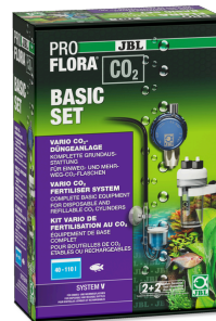
JBL PROFLORA CO2 BASIC ZESTAW V Instalacja do nawożenia CO2 BEZ BUTLI do roślin akwar