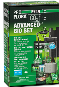
JBL PROFLORA CO2 ADVANCED BIO ZESTAW Instalacja do nawożenia Bio-CO2 do akw. słodk. 40-110 l