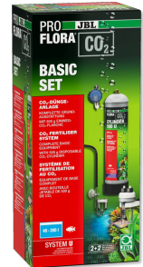
JBL PROFLORA CO2 BASIC ZESTAW U Instalacja nawoż. CO2. Podst. kompl. zestaw do roślin akwa