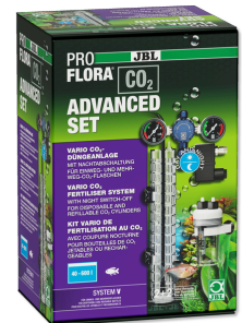
JBL PROFLORA CO2 ADVANCED ZESTAW V Instalacja CO2. BEZ BUTLI z manometrami & zaworem magnetycznym