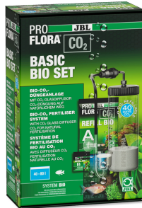
JBL PROFLORA CO2 BASIC BIO ZESTAW Instalacja do nawożenia Bio-CO2 do akw. słodk. 40-80 l