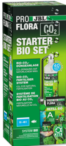
JBL PROFLORA CO2 STARTER BIO ZESTAW Instalacja do nawożenia Bio-CO2 do akw. słodk. 10-40 l