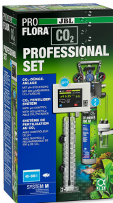
JBL PROFLORA CO2 PROFESSIONAL ZESTAW M Instalacja nawożenia roślin CO2 z komputerem steruj. CO2