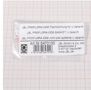
JBL PF CO2 Uszczelka płaska do U