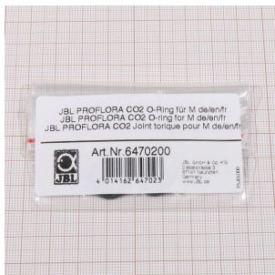
JBL PROFLORA CO2 уплотн. кольцо для М