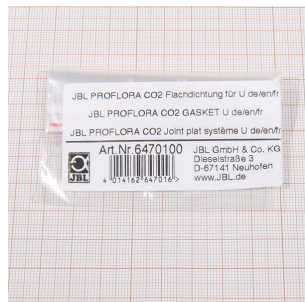
JBL PF CO2 плоское уплотнение для U