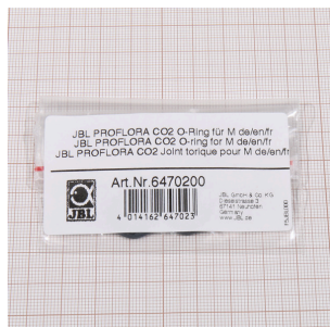
JBL PROFLORA CO2 O- Ring do M