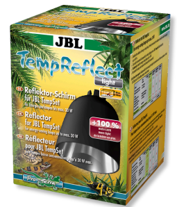
JBL TempReflect light Réflecteur pour lampes basse consommation