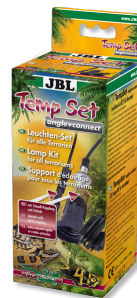
JBL TempSet angle+connect Kit d'installation pour spot de terrarium