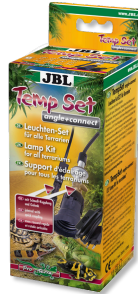
JBL TempSet angle+ connect Kit d'installation pour spot de terrarium