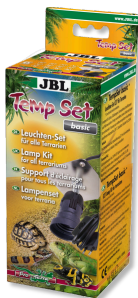
JBL TempSet basic Kit d'installation pour spot de terrarium