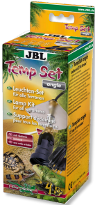
JBL TempSet angle Kit d'installation pour spot de terrarium