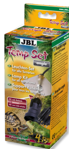
JBL TempSet angle Kit d'installation pour spot de terrarium