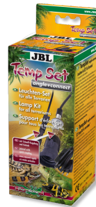
JBL TempSet dirsek+ bağlantı Teraryumlarda kull. spot lambalar için montaj seti