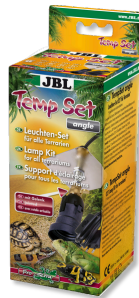
JBL TempSet dirsek Teraryumlarda kull. spot lambalar için montaj seti