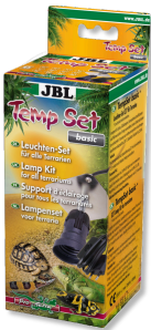
JBL TempSet basic Teraryumlarda kull. spot lambalar için montaj seti