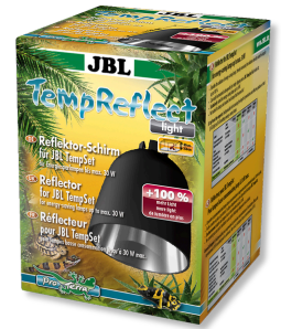
JBL TempReflect light Enerji etkin lambalar için reflektör kalkanı