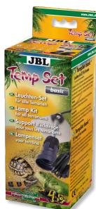
JBL TempSet basic Instalační sada pro terarijní zářivky