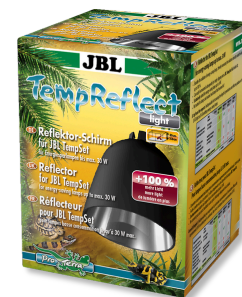
JBL TempReflect light Žárovka pro energeticky úsporné zářiče