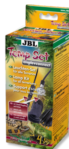
JBL TempSet angle+ connect Instalační sada pro terarijní zářivky