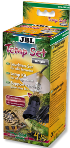
JBL TempSet angle Kit d'installation pour spot de terrarium