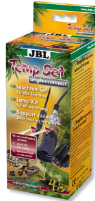
JBL TempSet angle+ connect Kit d'installation pour spot de terrarium