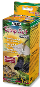
JBL TempSet dirsek Teraryumlarda kull. spot lambalar için montaj seti