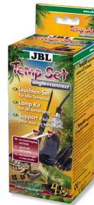
JBL TempSet dirsek+ bağlantı Teraryumlarda kull. spot lambalar için montaj seti