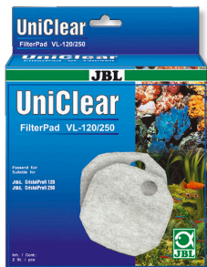
JBL FilterPad VL Filterwattenvlies voor aquariumfilter CristalProfi