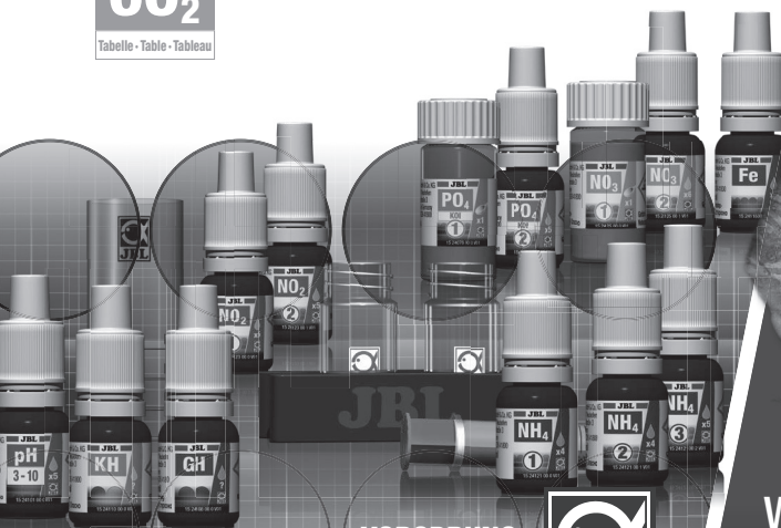
Tabella • Table • Tableau